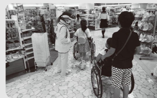
アピタで車いすに乗って買い物

車いすに乗ると高い所が見えないし、広い道しか通れなくて、いつも当たり前にやっていることができなくて、とても大変だった。(小4)