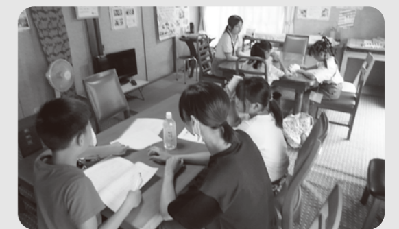
夏休みの宿題を終わらせよう

小学生の子たちに、勉強を教えたり、お話ししたり、ゲームをしたりして楽しく過ごすことができた。将来、教師をめざす気持ちが高まった。(高3)