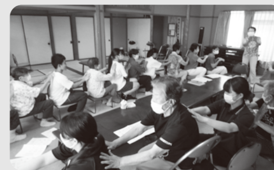
タッピングで心と体をリラックス

一緒にお話しながら、健康測定をしたり、体を動かしたり、歌ったりして、高齢者の方との関わり方や地域の活動を学ぶことができた。(高1)